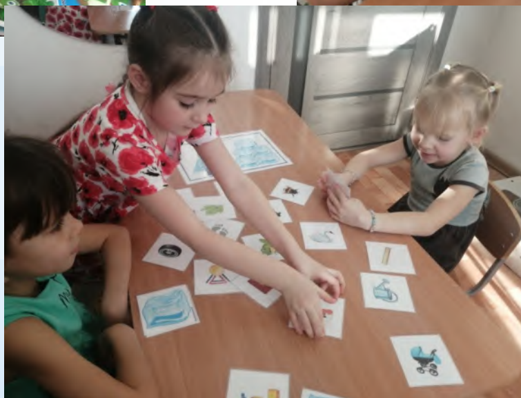
Использование пособия «Эльза заморозила» для автоматизации и дифференциации звуков з и зь