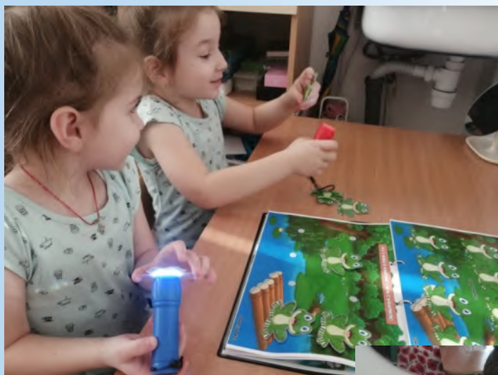
Игры с фонариком на автоматизацию поставленных звуков